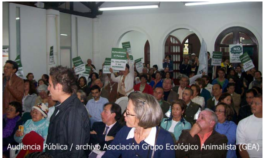
Audiencia Pública

Diferentes actores de la localidad, entre los que se destacan los grupos ambientalistas, la Mesa Interlocal del río Salitre, las Juntas de Acción Comunal (JAL), ONGs, conjuntos residenciales, algunos ediles y muchos residentes, han organizado actividades tales como: manifestaciones pacíficas, campañas a favor de la conservación del humedal, divulgación en diferentes medios de prensa sobre la existencia de este y el más sobresaliente hasta este momento, una audiencia pública efectuada el 21 de agosto de 2009 en la Junta Administradora Local.